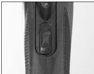
La « sûreté » montrée en position « sécuritaire ».