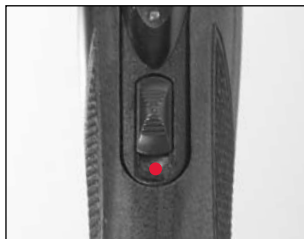
La « sûreté » montrée en position « non sécuritaire ».