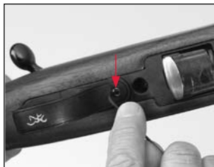
Réglez la détente à l'aide d'une clé hexagonale de 1/16".